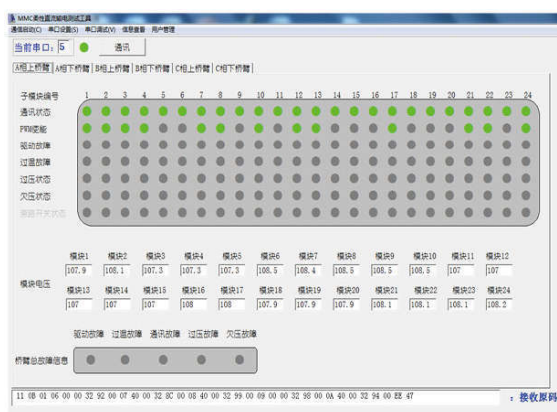
A 相上桥臂各子模块电压显示图